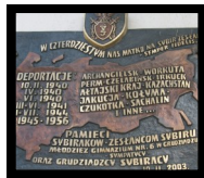
Tablica Pamięci Sybiraków w Gimnazjum nr 6