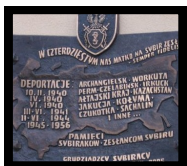
Tablica Pamięci Sybiraków na RZĄDZU