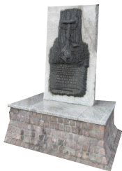
Obelisk - tablica przy kościele NMP