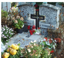
Grób – Mogiła w ciągu Mogił Pamiątkowych na cmentarzu parafialnym