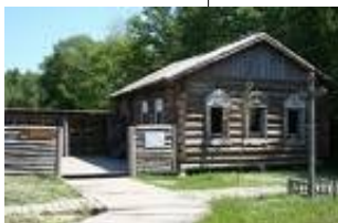
Dom Sybiraka w Szymbarku