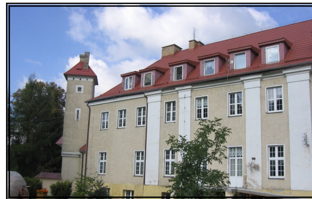
Dom Dziecka w Szymonowie

Nauczyciele i młodzież Gimnazjum nr 6 w Grudziądzu oraz grudziądzcy Sybiracy zainteresowali się działalnością Domu dla Dzieci im. Sybiraków w Szymonowie. Wszyscy mamy nadzieję poznania losów dzieci i historię ich domu poprzez aktywną współpracę w przyszłości.