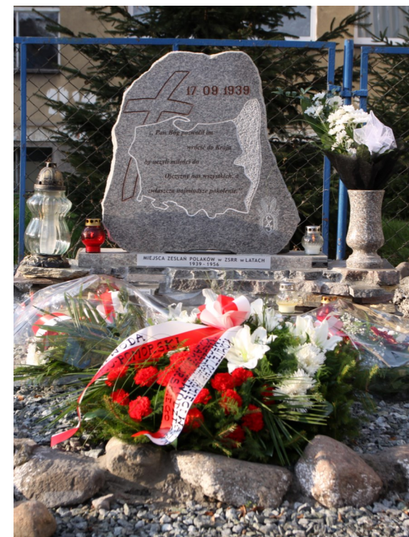
Obelisk w Grudziądzu przy budynku Gimnazjum nr 6 im. Sybiraków

„Pan Bóg pozwolił im wrócić do kraju by uczyli miłości do Ojczyzny nas wszystkich, a zwłaszcza młode pokolenie”