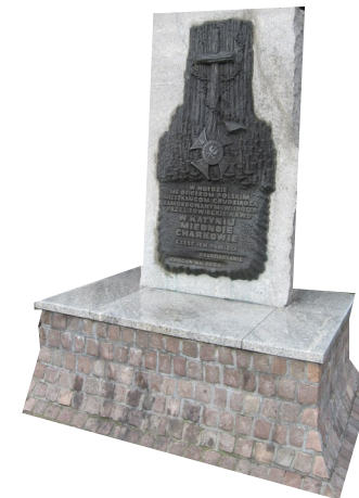
Obelisk - tablica przy kościele NMP

Po agresji Związku Sowieckiego na Polskę 17 września 1939 r. do niewoli dostało się wiele tysięcy Polaków. Szczególnie okrutny los spotkał polskich oficerów, policjantów, inteligencję. Elita polskiego społeczeństwa została uwięziona w trzech obozach: Starobielsku, Kozielsku i Ostaszkowie, a potem wymordowana przez funkcjonariuszy NKWD. Wiosną i latem 1940 r. w kilku egzekucjach w Katyniu i Miednoje zamordowano około 20 tys. osób. Władze sowieckie ukrywały ten fakt aż do lat dziewięćdziesiątych XX w.