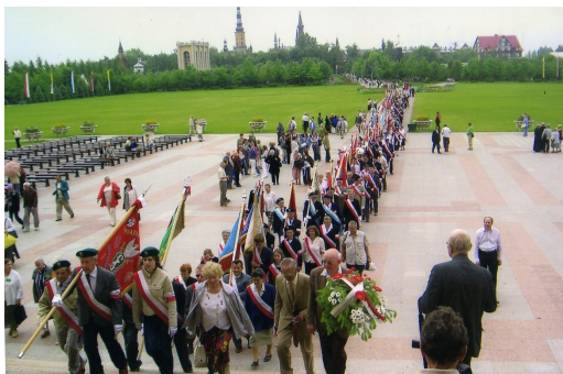
Poczty Sztandarowe wchodzące do Bazyliki.

W 1992 roku do Związku Sybiraków należało 86680 członków zrzeszonych w 54 Oddziałach i 462 kolach terenowych.