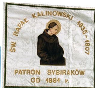
Św. Rafał Kalinowski - patron Sybiraków, dla Niego również Syberia stała się przymusowym domem