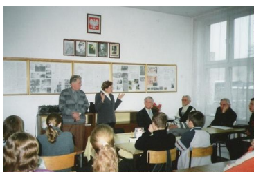
Od lutego 2004 żywe lekcje patriotyzmu prowadzone przez Sybiraków odbywają się na godzinach wychowawczych w Izbie Pamięci w Gimnazjum nr 6

Sztandar Sybiraków został poświęcony w tym samym dniu, co tablica pamiątkowa umieszczona na budynku Gimnazjum nr 6 w Grudziądzu, i w dniu nadania imienia Sybiraków Gimnazjum nr 6, tj. 23 maja 2003 roku.