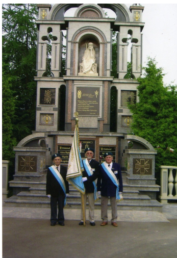
16 czerwca 2005 roku udział w pielgrzymce do Lichenia.

Członkowie naszego Koła biorą aktywny udział w ogólnopolskiej, corocznej, czerwcowej pielgrzymce do Lichenia . Odbywają się kolejno: przemarsz Pocztów Sztandarowych do Bazyliki Wielkiej, uroczysta Msza św. oraz Droga Krzyżowa. Ważną częścią pielgrzymki jest Apel Poległych przed Pomnikiem – Monumentem Pamięci Sybiraków (znajduje się on po lewej stronie przy wejściu do Bazyliki).