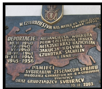
Tablica Pamięci Sybiraków w Gimnazjum nr 6

Uroczystość nadania Krzyża Zesłańców Sybiru odbyła się 9 czerwca 2005 roku w Gimnazjum nr 6 w Grudziądzu.