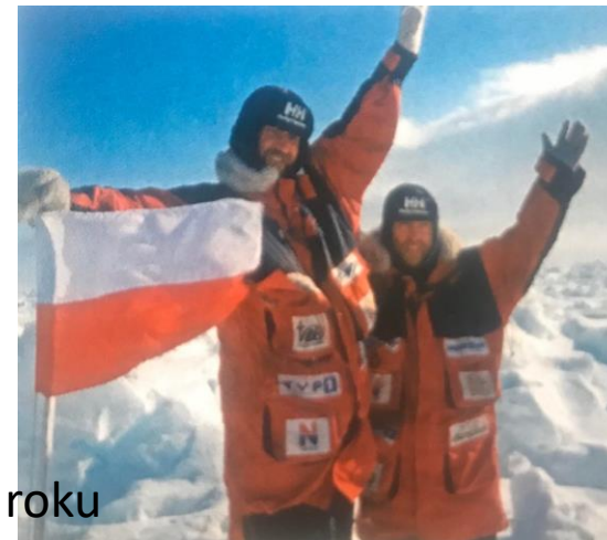
Polacy na biegunie północnym w 1995 roku